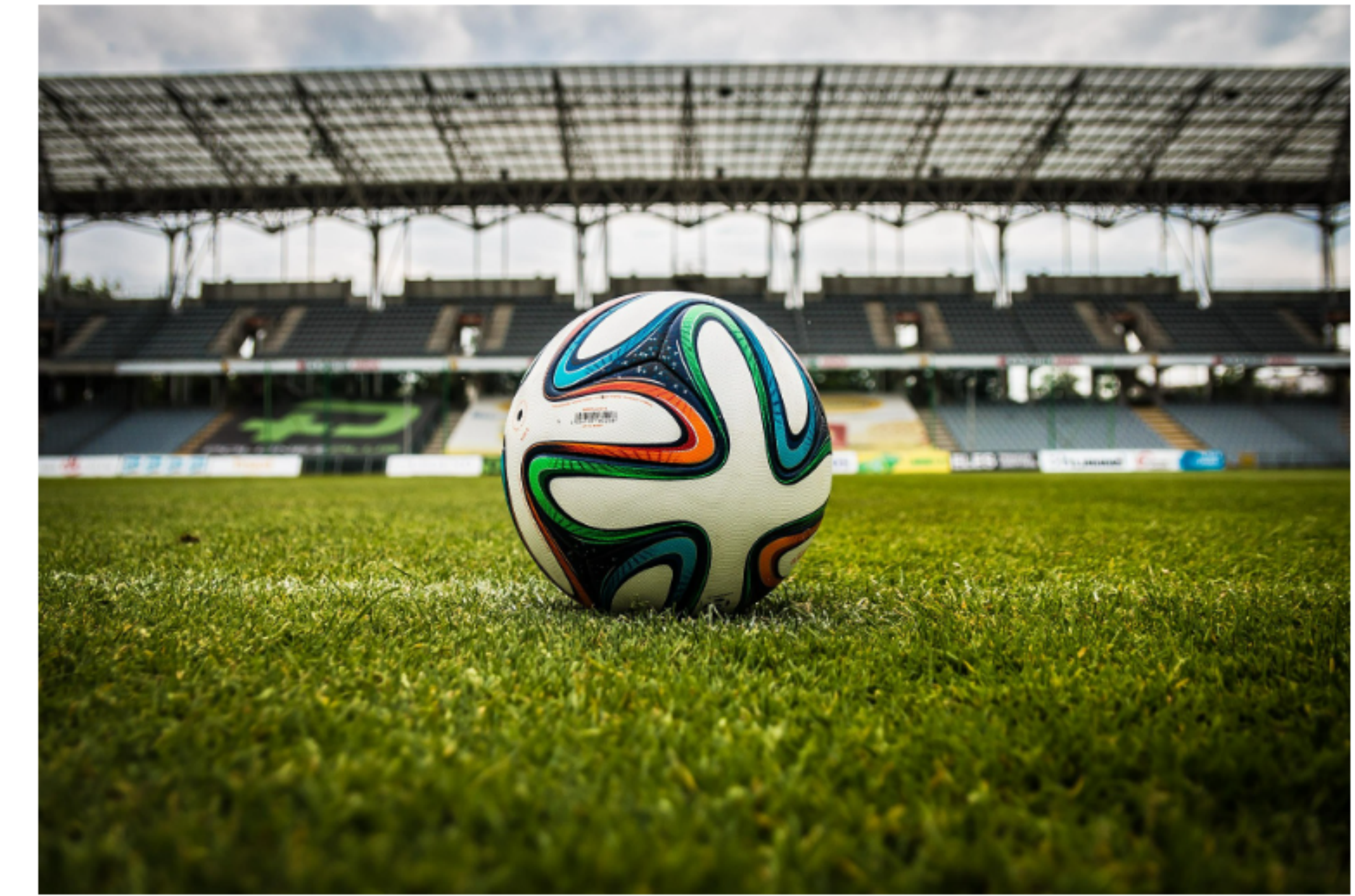
체육행사 중 사고