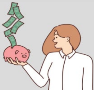
급여 청구 및 지급절차 안내