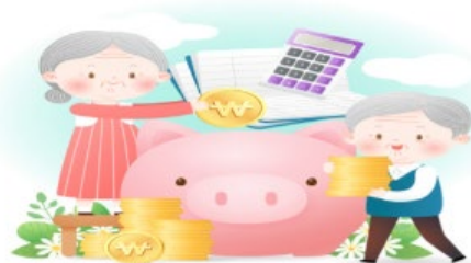
퇴직소득세 계산 방법