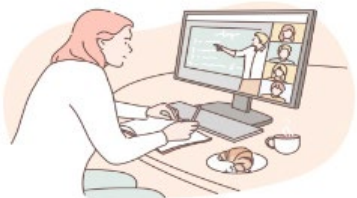
퇴직예정공무원을 위한 연금제도 온라인 설명회