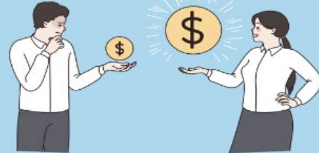
급여종류 변경 알아보기