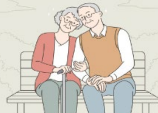
명예퇴직수당 합산과세 처리방법