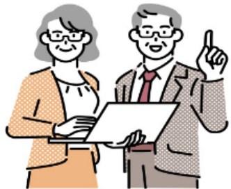
퇴직연금 인터넷 청구방법