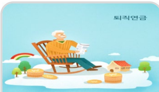
연금지급개시연령 및 조기퇴직연금