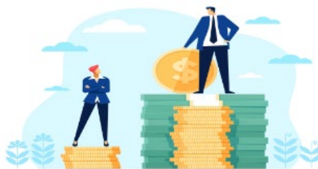
급여 제한과 유보