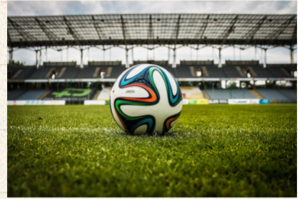
체육행사 중 사고