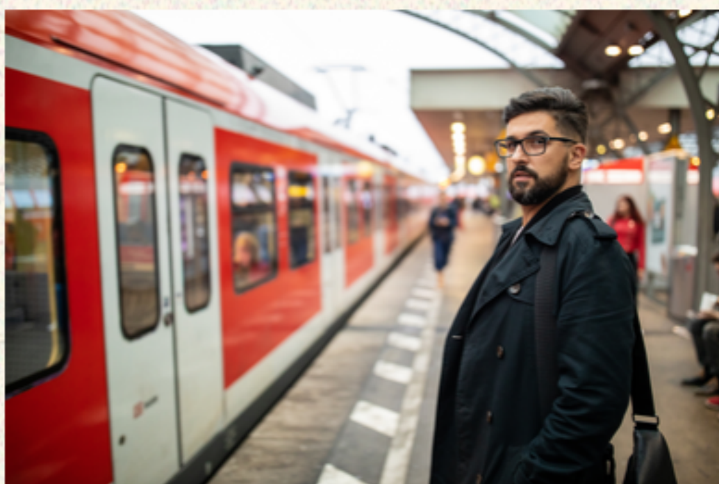
출퇴근길 발생한 사고