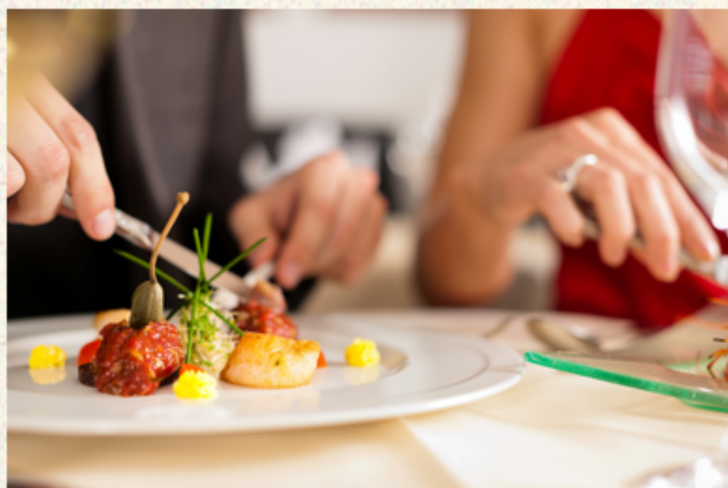
점심시간에 발생한 사고