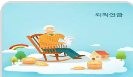
연금지급개시연령 및 조기퇴직연금