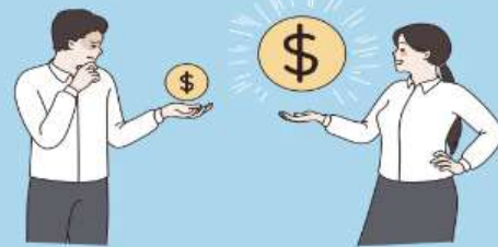
급여종류 변경 알아보기