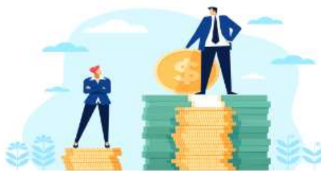
급여 제한과 유보