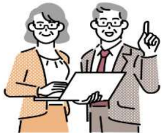
퇴직연금 인터넷 청구방법