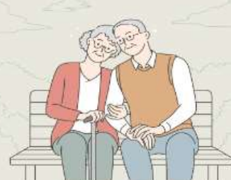
명예퇴직수당 합산과세 처리방법