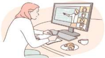
퇴직예정공무원을 위한 연금제도 온라인 설명회