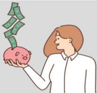
급여 청구 및 지급절차 안내