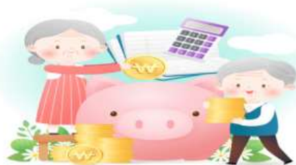
퇴직소득세 계산 방법