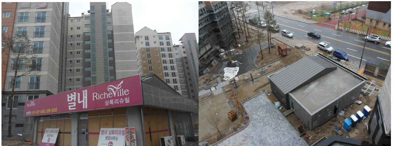
< 사 진 >

※ 물건의 입지여건, 주변환경, 사업성 등은 계약자가 판단 결정하셔야합니다. 공단은 입찰자가 자료 요청 시 제공을 할 수 있습니다.