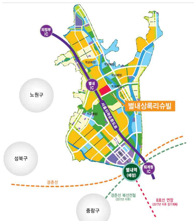
<위 치 도>