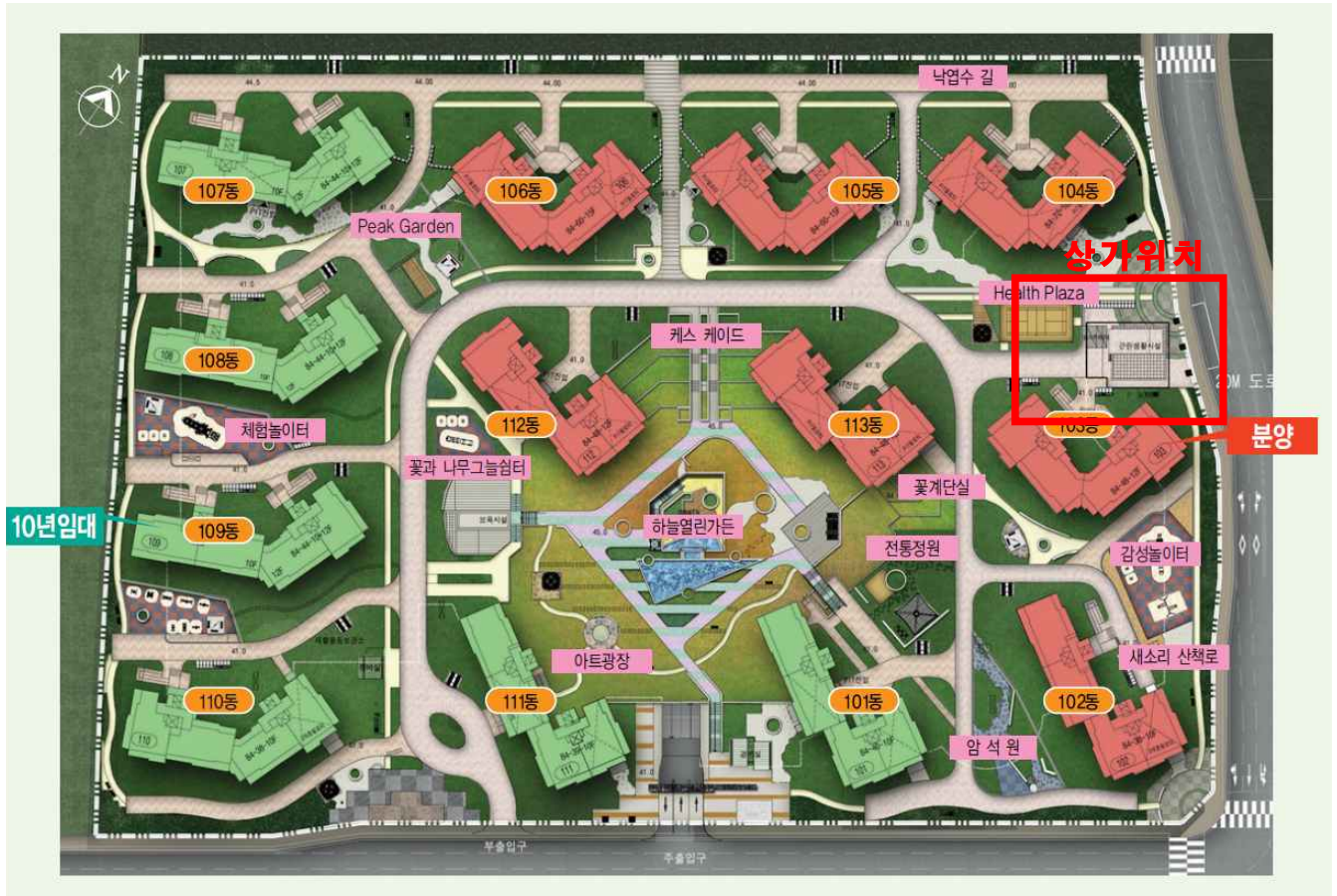
<배 치 도>