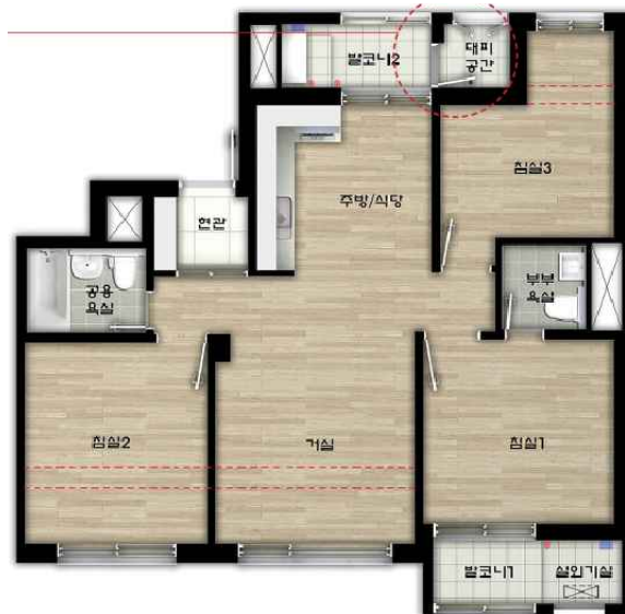
74A 단위세대 평면도 (확장형)