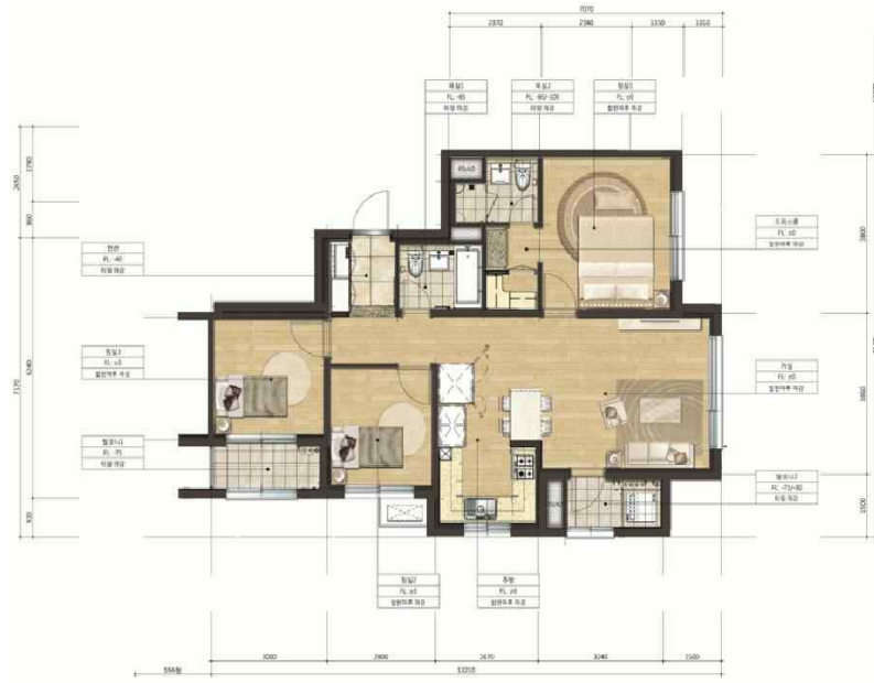
■ Floor plan