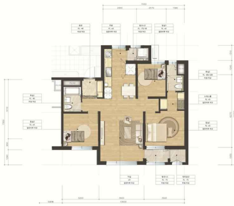
■ Floor plan