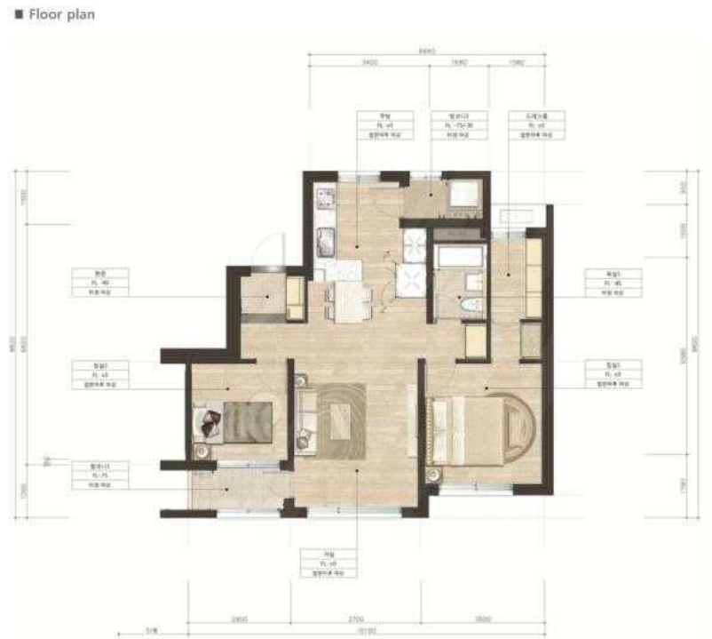
59A 단위세대 평면도(확장형)