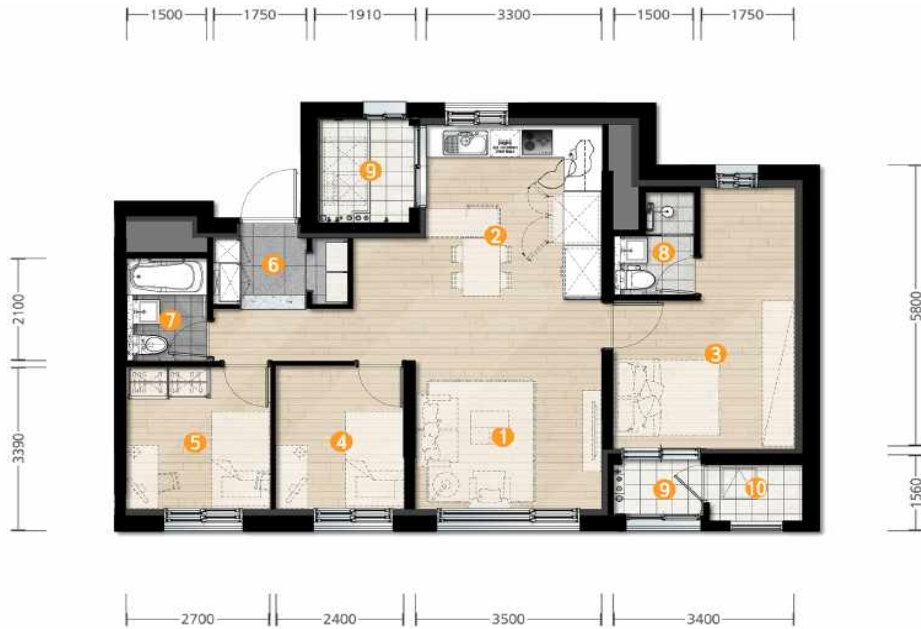
[ 59A, 59A(E)형 ]

① 거실 ② 주방 ③ 침실1 ④ 침실2 ⑤ 침실3 ⑥ 현관 ⑦ 공용욕실 ⑧ 부부욕실 ⑨ 발코니 ⑩ 대피공간