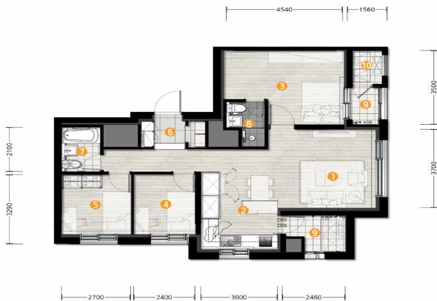
[ 59B형 ]

① 거실 ② 주방 ③ 침실1 ④ 침실2 ⑤ 침실3 ⑥ 현관 ⑦ 공용욕실 ⑧ 부부욕실 ⑨ 발코니 ⑩ 대피공간