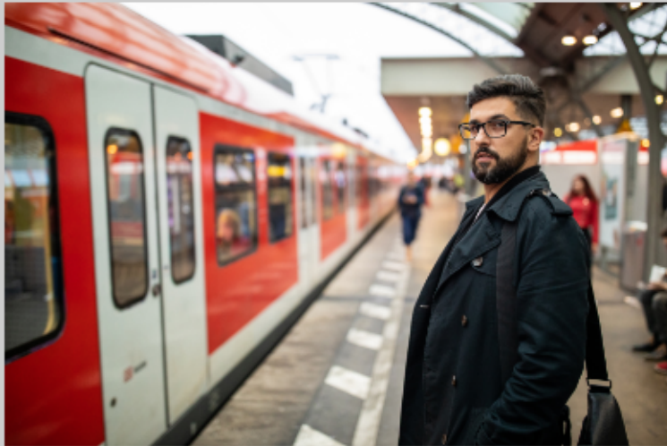
출퇴근길 발생한 사고