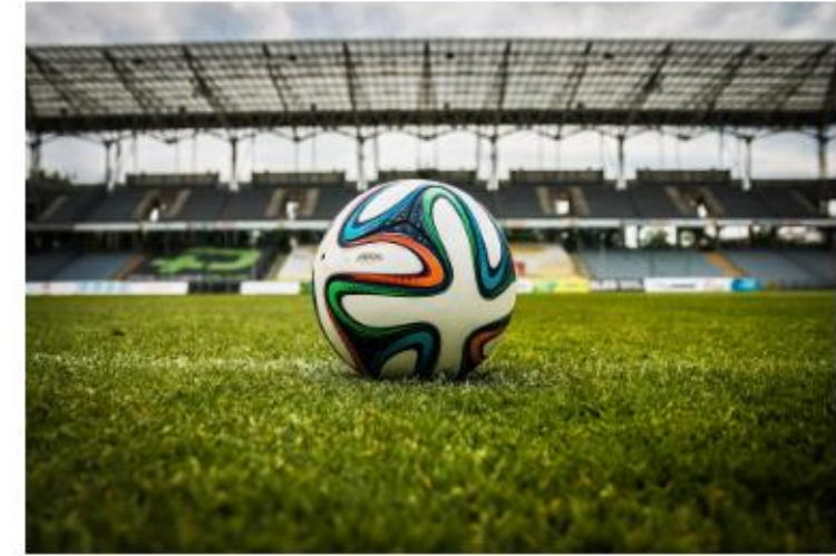
체육행사 중 사고