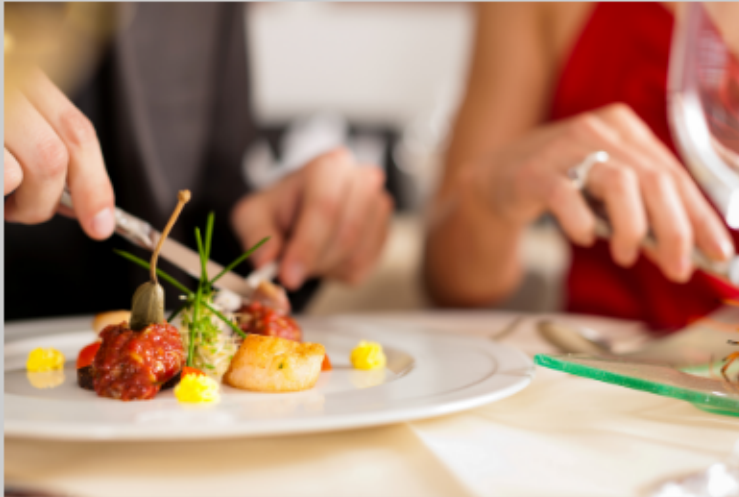
점심시간에 발생한 사고