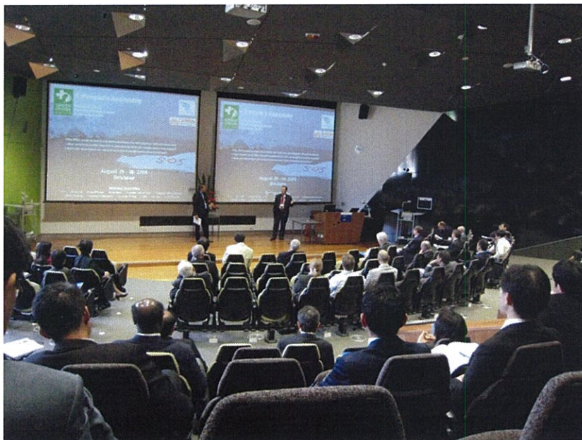
전체 세션(Plenary Session) 진행 모습